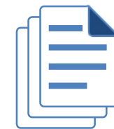
Physical submission to headquarters

Reducing the impact on environment with paperless management is of great importance to Novartis. Therefore we would like to encourage you to choose e-mail submission, also for faster invoice processing and payment for provided services/goods.