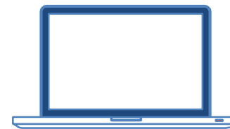
Soumission par e-mail

Deux canaux de communication sont à votre disposition pour l'envoi des factures :